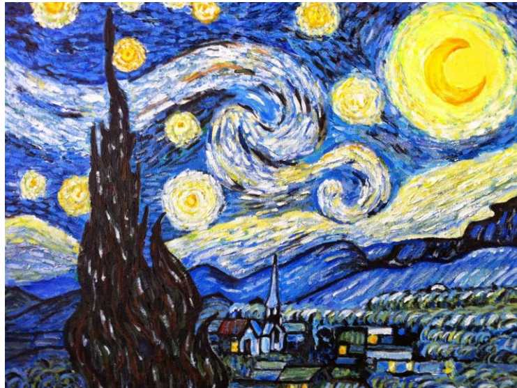
Vinsent van Gog "Yulduzli oqshom"

Rassom Anri Russo o'z davrida tamom ila o'zgacha va yangi soddalik bilan o'z rasmlarida sodda va o'z-o'zidan sehrlangan dunyoni yaratdi va XX asr san'atida primitivizmga yo'l ochdi.