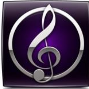
Sibelius nota muharriri belgisi.

Sibelius nota muharririni musiqiy ta'lim mutaxassisligi bo'yicha tahsil olayotgan institut talabalari tomonidan o'rganish tizimli, ilmiy, yaxlitlik, ko'p funkcionallik, shuningdek, shaxsga yo'naltirilgan yondashuv tamoyillariga asoslangan.